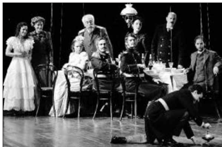
Representación de la obra de Chejov "Tres hermanas"

Sensibilidad. Esto es lo que falta en nuestro país. La carencia de sensibilidad es notoria y llama la atención a los que, viniendo de otros lugares, nos visitan. Somos el país del ruido, de los bares en los que conviven a la vez una radio o reproductor de canciones, una televisión, y muy a menudo, una máquina tragaperras que nos regala con sus chirriantes o percusionantes sonidos. Y, naturalmente, para poder hablar con